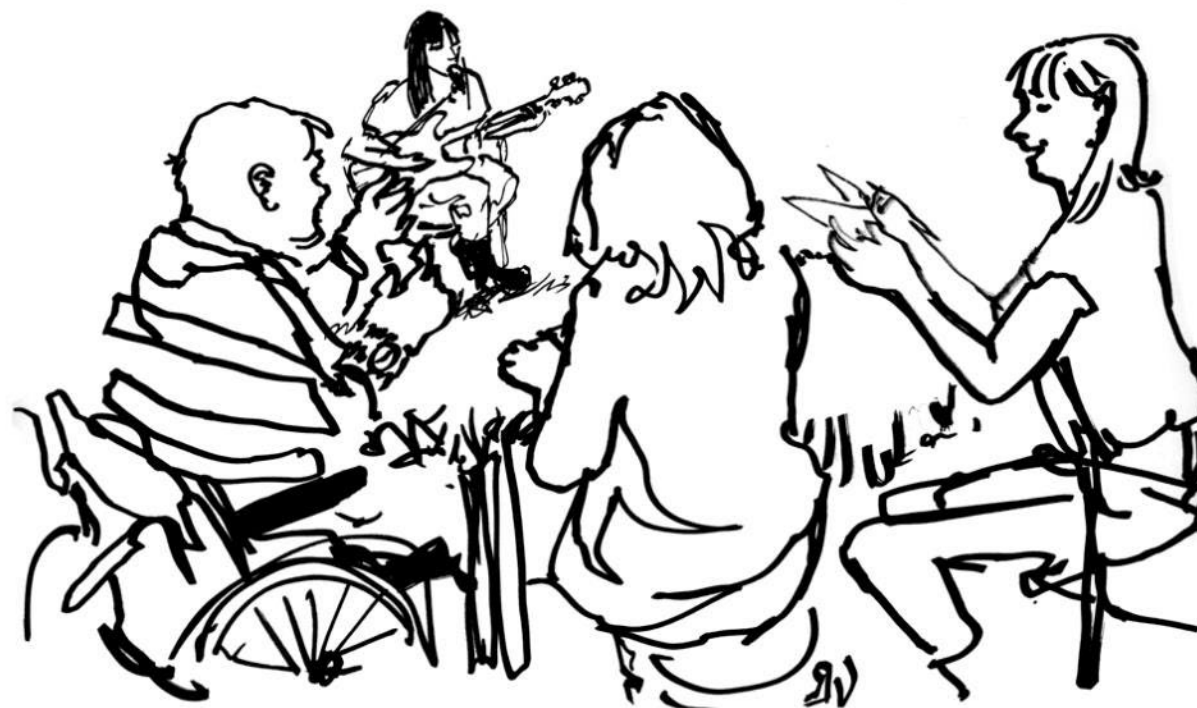
Illustration: Jenny Soep